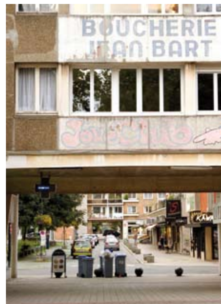
Et si on s'intéressait enfin aux façades de notre centre-ville ?

Nous serons ambitieux sur l'accompagnement éducatif, en lien étroit avec l'Éducation nationale. Deux exemples : nous mettrons le paquet sur l'apprentissage de l'anglais pour que, dans 15 ans, Dunkerque soit la ville de France où cette langue est la mieux maîtrisée. Et nous créerons une académie d'été pour accompagner les élèves en difficulté.